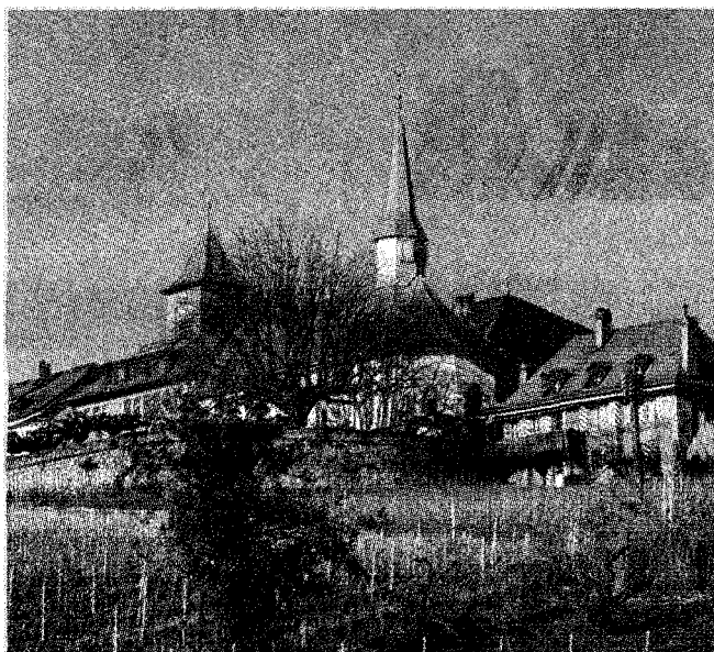
Pully (ici, le Prieuré) termine dans le trio de tête dans chacune des quatre catégories de l'étude.